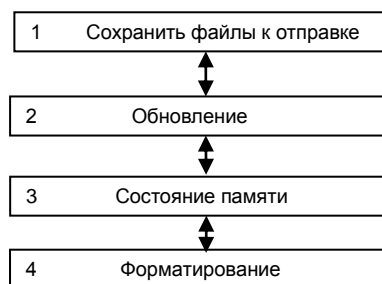
Рисунок 4 – Структура меню режима « USB накопитель »

6.4.3 При переходе в пункт меню USB накопитель на дисплее терминала отображается меню, показанное на рисунке 4.