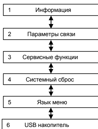
Рисунок 2 – Структура меню режима «Восстановление ПО»

При загрузке терминала в режим «Восстановление ПО» на его дисплее отобразится главное меню, показанное на рисунке 2.